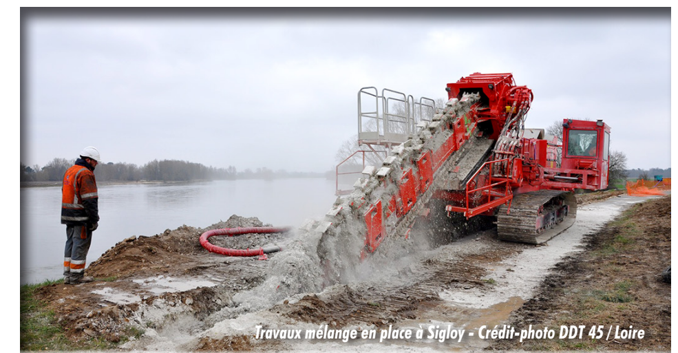
Travaux mélange en place à Sigloy

Ce programme pourra être adapté en fonction des conclusions de l'étude des vals du giennois en cours de réalisation ■