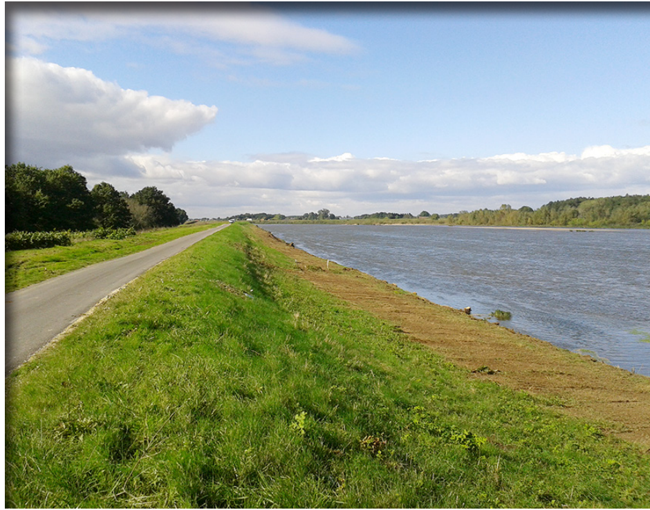
Digue de Sully-sur-Loire

Les résultats exposés précédemment sont obtenus par des modèles mathématiques (hydraulique, géotechnique, aléas de rupture,...), et de l'état de la connaissance scientifique ■